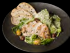
CEZARIO SU VIŠTIENA IR ANČIUVIŲ PADAŽU