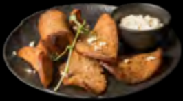
KEPINTI DUONOS TRAŠKUČIAI