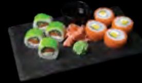
„PHILADELPHIA MAKI“ 4 vnt. + „KAPPA SAKE MAKI“ 4 vnt.