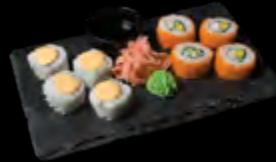
„CALIFORNIA MAKI“ 4 vnt. + „SAPPORO TATAKI MAKI“ 4 vnt.