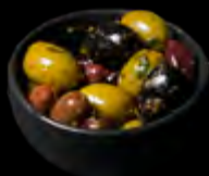
MARINUOTŲ ALYVUOGIŲ RINKINYS