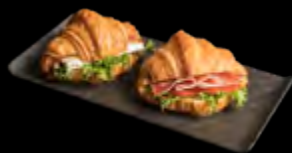
KRUŠASANAS • SU VYTINTU KUMPIU • SU BRIE SŪRIU