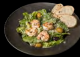
CEZARIO SU KREKETĖMIS IR ANČIUVIŲ PADAŽU