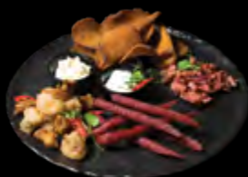
RINKINYS PRIE ALAUS