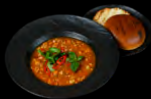
AITRIOJI MĖSOS SRIUBA