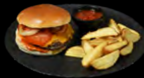
MĖSAINIS SU BRANDINTA JAUTIENA