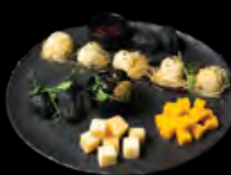
RINKINYS PRIE VYNO