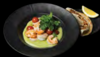
KREKETĖS „TIKKA MASALA“