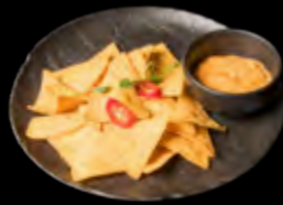
MEKSIKIETIŠKI TRAŠKUČIAI SU SŪRIO PADAŽU