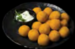
GRUZDINTOS SŪRIO SPURGYTĖS