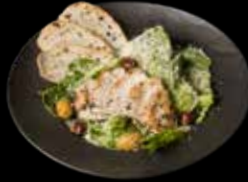
CEZARIO SU VIŠTIENA IR ANČIUVIŲ PADAŽU