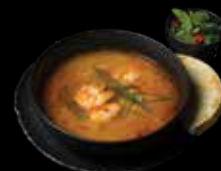
„THAI TOM YUM“