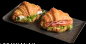
KRUASANAS • SU VYTINTU KUMPIU • SU BRIE SŪRIU