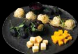
RINKINYS PRIE VYNO