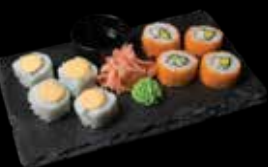
„CALIFORNIA MAKI“ 4 vnt. + „SAPPORO TAKI MAKI“ 4 vnt.