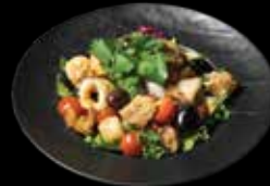
SU GRUZDINTAIS KALMARAIS