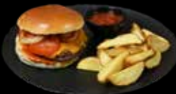
MĖSAINIS SU BRANDINTA JAUTIENA