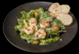
CEZARIO SU KREKETĖMIS IR ANČIUVIŲ PADAŽU