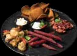
RINKINYS PRIE ALAUS