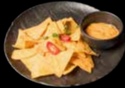
MEKSIKIETIŠKI TRAŠKUČIAI SU SŪRIO PADAŽU