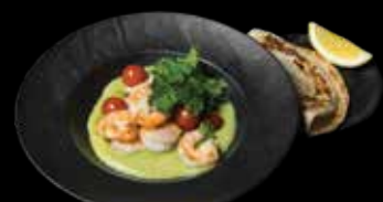
KREKETĖS „TIKKA MASALA“