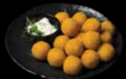
GRUZDINTOS SŪRIO SPURGYTĖS