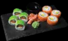
„PHILADELPHIA MAKI“ 4 vnt. + „KAPPA SAKE MAKI“ 4 vnt.