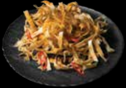
AŠTRIOS LAVAŠO JUOSTELĖS