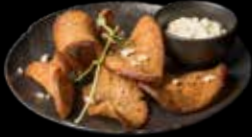
KEPINTI DUONOS TRAŠKUČIAI